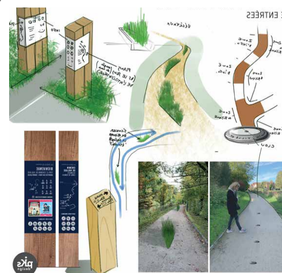
CHEMIN DE HALAGE, MARCO EN BAROEUL

Rassemblés autour de six grands thèmes - l'économie circulaire, la ville collaborative, l'habitat, la mobilité, l'action publique, le soin, - les POC ont aujourd'hui une résonance particulière, en phase avec les aspirations des habitants, en quête d'un après COVID résolument soutenable et solidaire. Les Maisons POC font vivre ces thématiques grâce à des designers et experts qui accompagnent, orientent et valorisent les initiatives protéiformes des porteurs de POC.