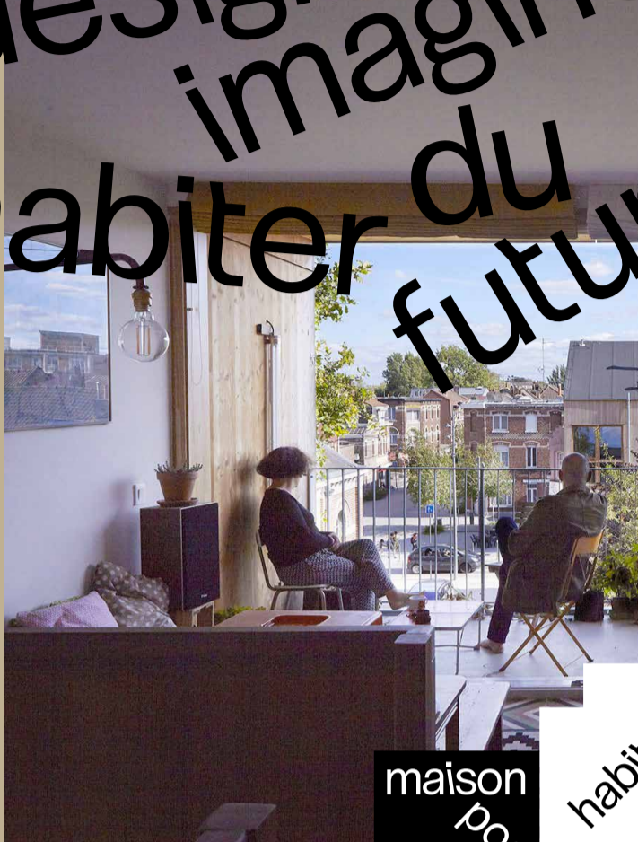
Habitat Participatif - Lille Bois-Blancs - HBAAT