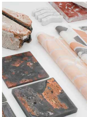
EXPÉRIMENTATIONS AUTOUR DE LA BRIQUE

Une production originale de Lille Métropole 2020, Capitale Mondiale du Design