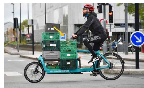
EXPÉRIMENTATIONS AUTOUR DE LA BRIQUE